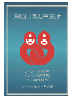
消防団協力事業所表示証

消防団協力事業所表示制度(総務省消防庁ホームページ) https://www.fdma.go.jp/relocation/syobodan/data/policy/cooperation-system/