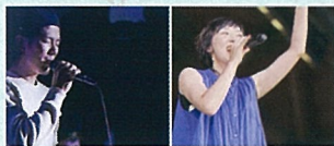
ひーひん&亜沙美スペシャルLIVE